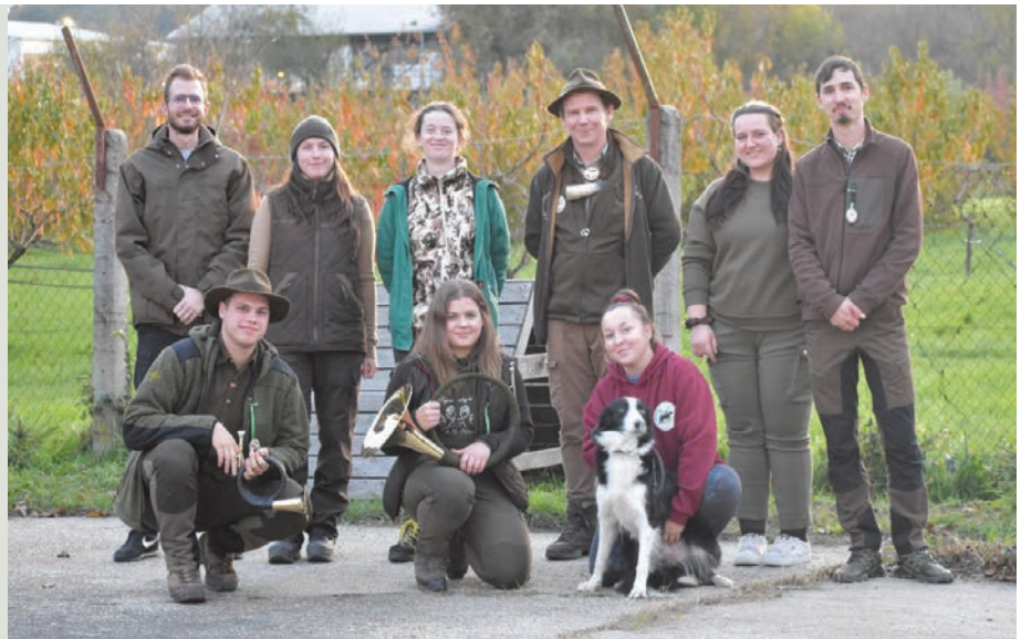
Spoločné foto so zástupcami SPU v Nitre – skúšky miniatúr jazvečikov (vlečka s králikom)