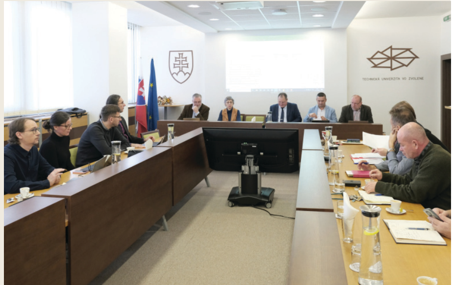
Pracovné stretnutie vedenia TUZVO so zástupcami MŠVVAM SR

V porovnaní s prvým periodickým hodnotením VER 2022 budú v pripravovanom hodnotení VER 2026 doplnené dva okruhy hodnotenia – v rámci každej žiadosti sa budú hodnotiť nielen výstupy tvorivej činnosti, ale aj jej spoločenský dopad a tiež samotné prostredie tvorivej činnosti.