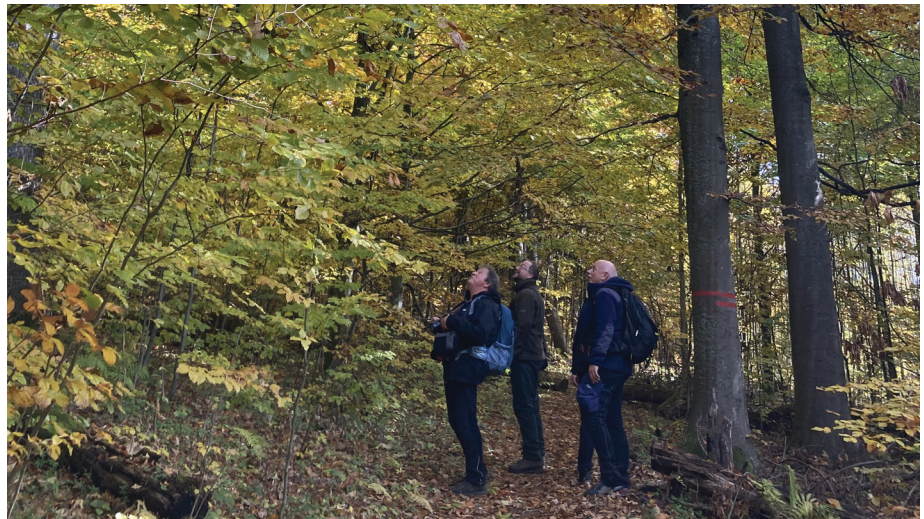
Odborná exkurzia v Dobročskom pralese