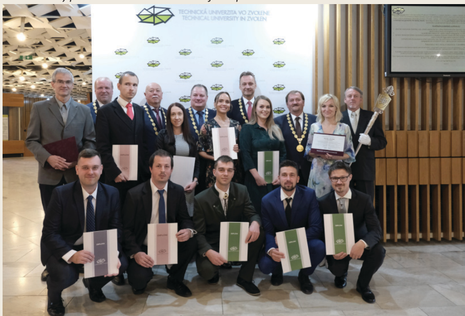
Noví doktori TUZVO