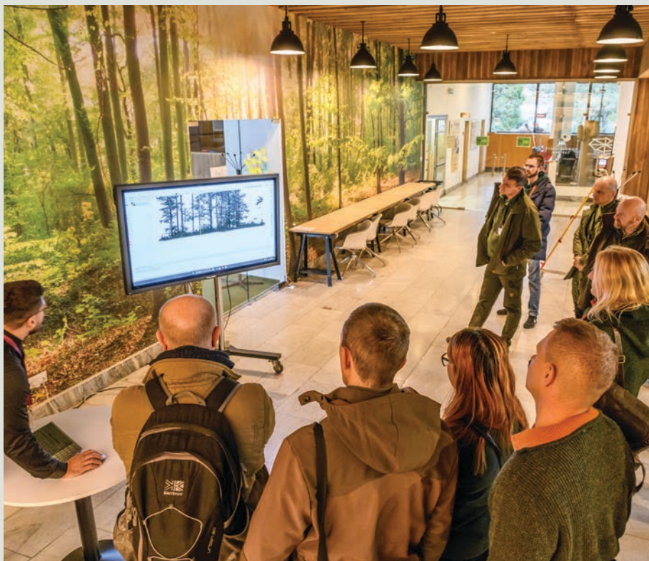
Účastníci konferencie mali možnosť oboznámiť sa s najnovšími technológiami

Konferencie sa zúčastnilo viac ako 80 účastníkov z rôznych inštitúcií, ktoré sa zameriavajú na monitoring lesných ekosystémov. Medzi účastníkmi boli zástupcovia Ministerstva životného prostredia, Slovenskej agentúry životného prostredia SR, Štátnej ochrany prírody, štátneho podniku Lesy Slovenskej republiky, stredných lesníckych škôl (SOŠL Tvrdošín, SOŠL Banská Štiavnica) a tiež výskumných inštitúcií, akými sú Národné lesnícke