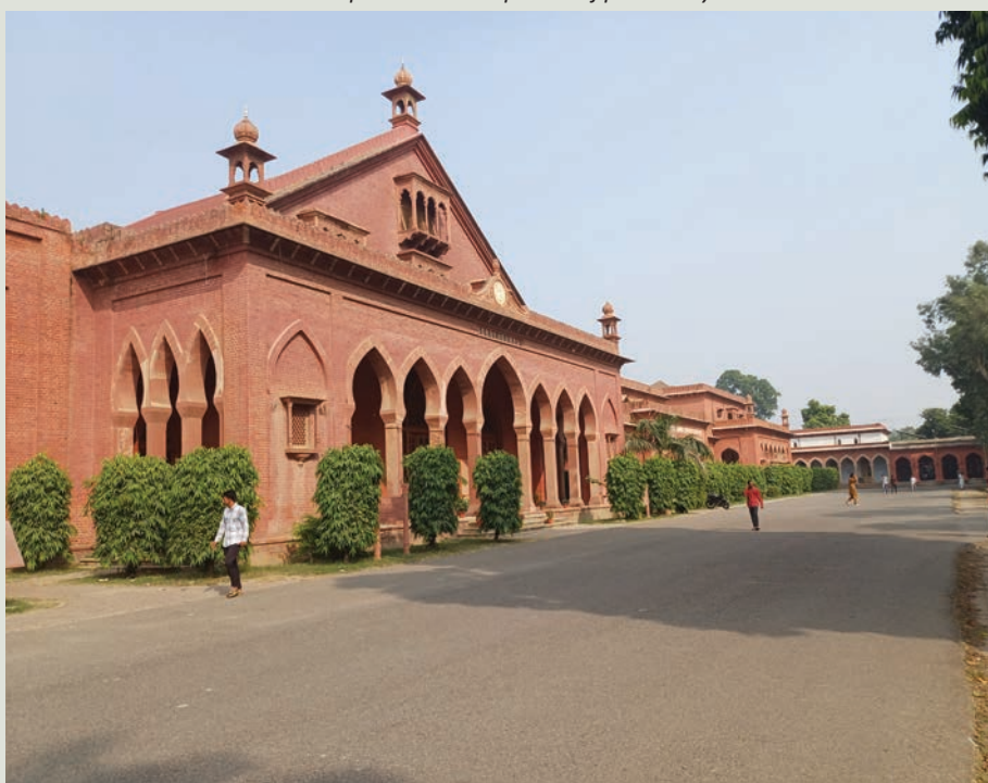
Jedna z mnohých budov univerzity