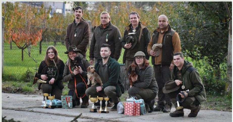
Spoločné foto s víťazmi z SPU v Nitre – skúšky miniatúr jazvečikov (vlečka s králikom)