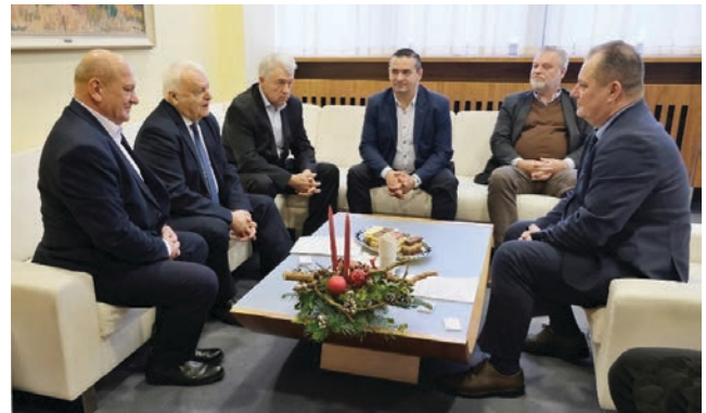
Prijatie ukrajinskej delegácie u rektora TUZVO