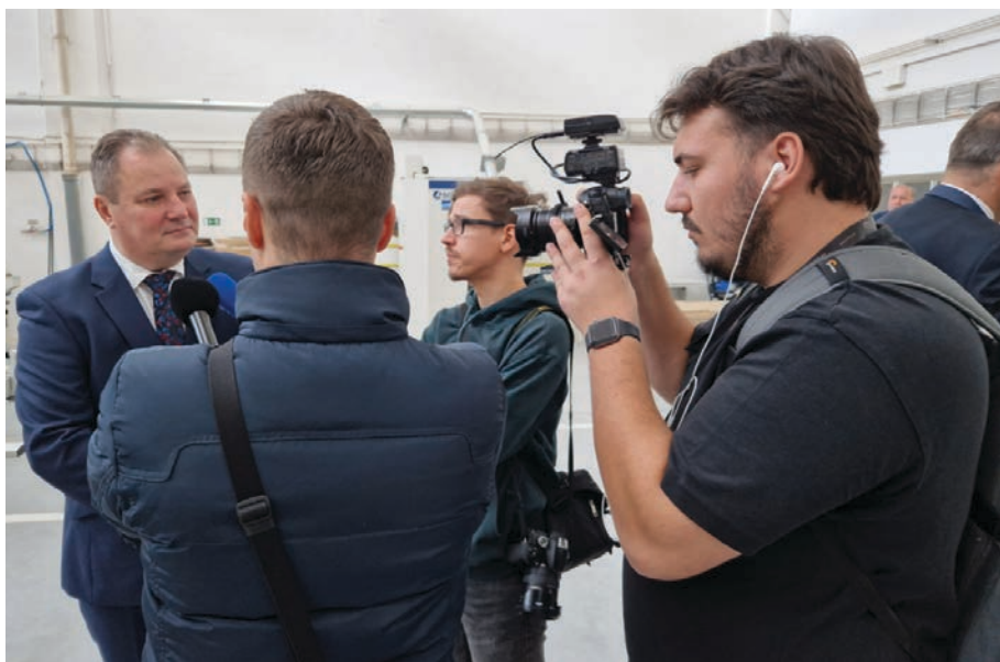
O zrekonštruované vývojové dielne a laboratória prejavili záujem aj médiá