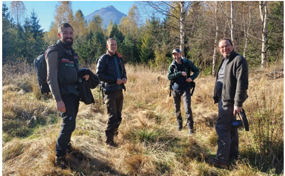
Návšteva Tatier, Dobroč a Hrončeckého grúňa bola sprevádzaná živou diskusiou