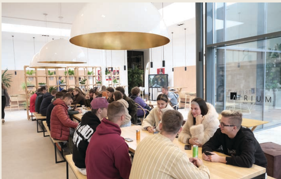
Prezentované filmy zaujali našich študentov

Ján Lichý, Rektorát