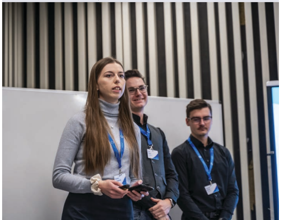
Prvé miesto obsadili študenti TUZVO