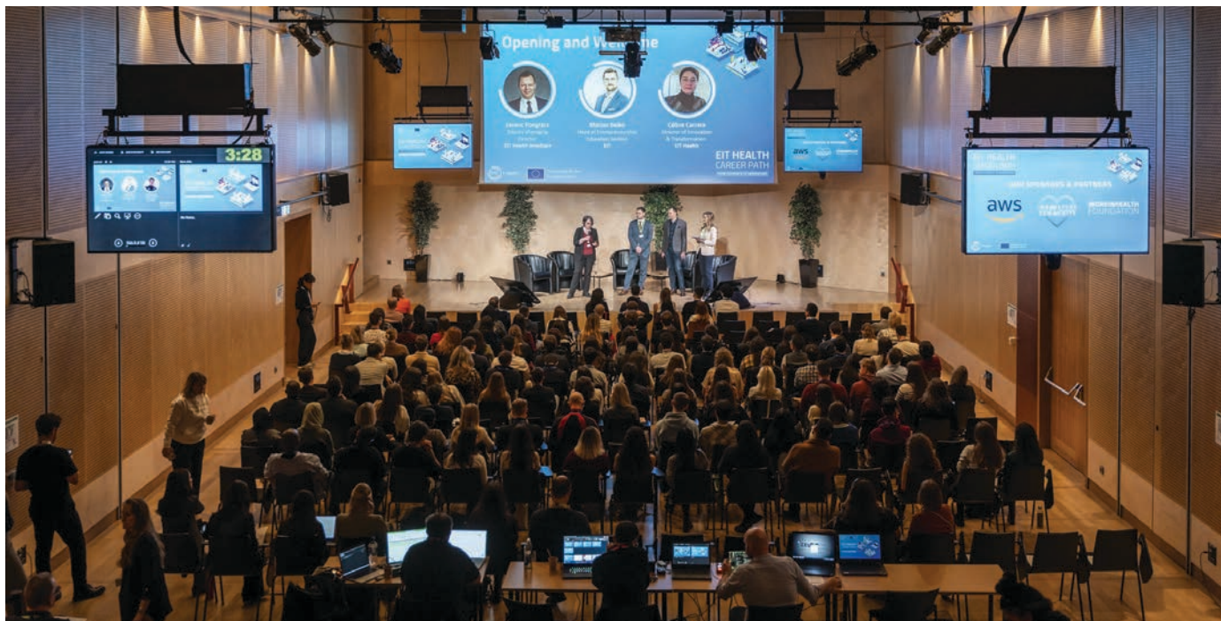
Priebeh medzinárodnej súťaže v Budapešti