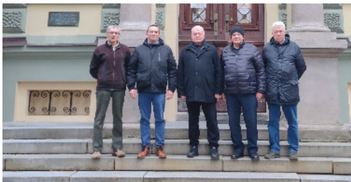
Návšteva Strednej odbornej školy lesníckej v Banskej Štiavnici