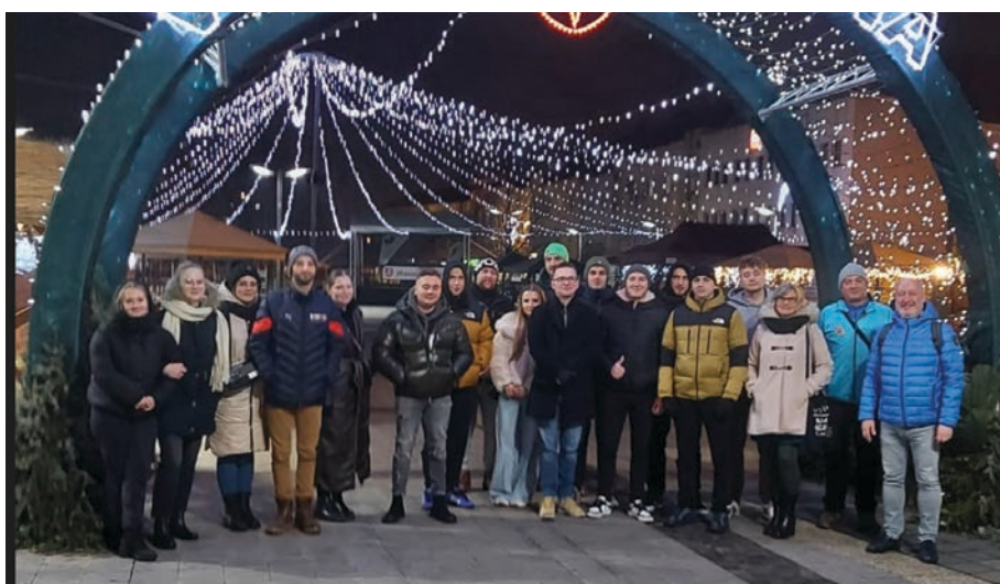
Kolegovia z Poľska navštívili aj vianočné trhy vo Zvolene

Prostredníctvom mobility ERASMUS+ máme už niekoľko rokov príležitosti predstavovať našu fakultu a zároveň celú univerzitu zahraničným študentom. Rozvíjame tak vzťahy na medzinárodnej úrovni vo všetkých stupňoch štúdia, ako aj