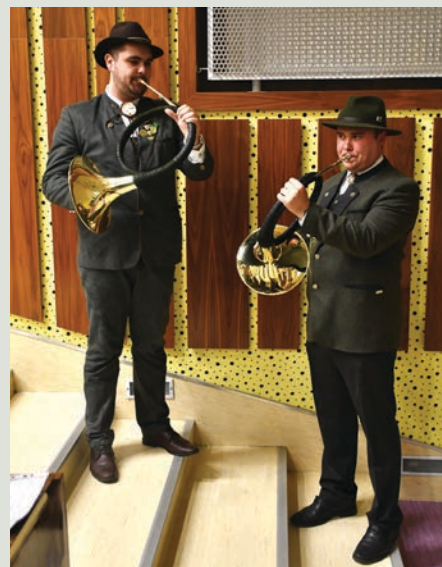
Trubači TUZVO pri slávnostnom otvorení