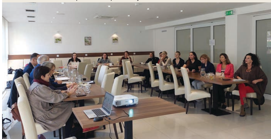
Účastníci vedeckej konferencie