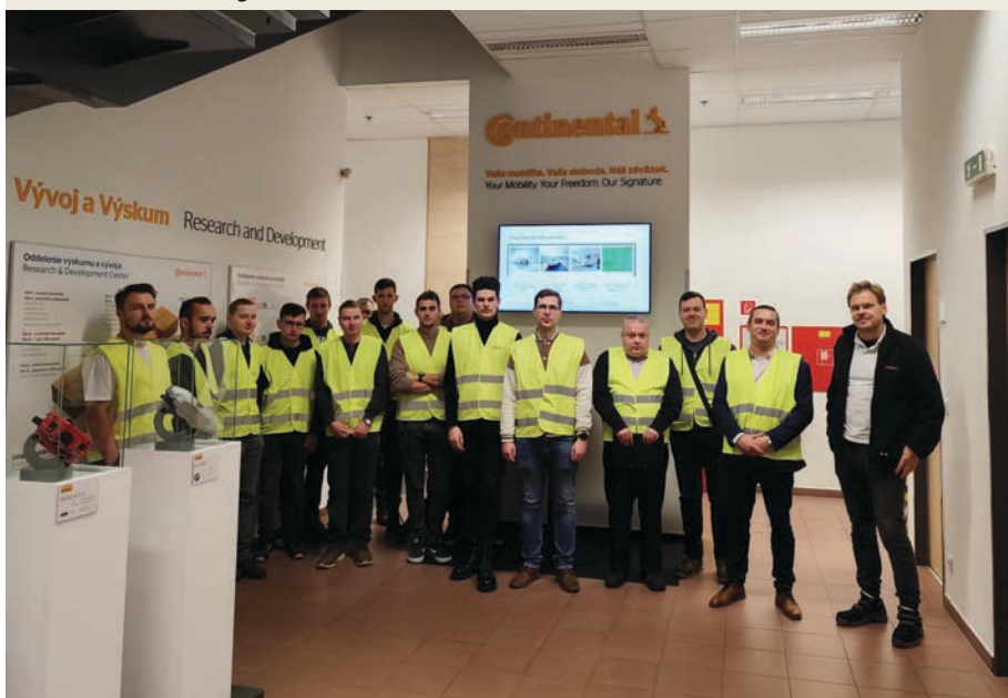
Exkurzia v prevádzkach CAS s.r.o Zvolen