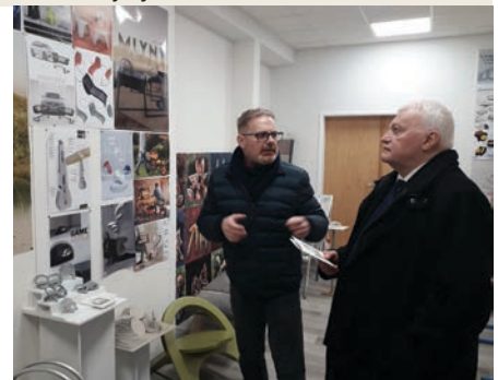
Rektora Ukrajinskej lesníckej národnej univerzity zaujalo umenie našich dizajnérov

Návšteva ukrajinskej delegácie na TUZVO priniesla nový impulz do rozvoja medzinárodnej spolupráce. Spoločné projekty, akademickej mobility a výmena