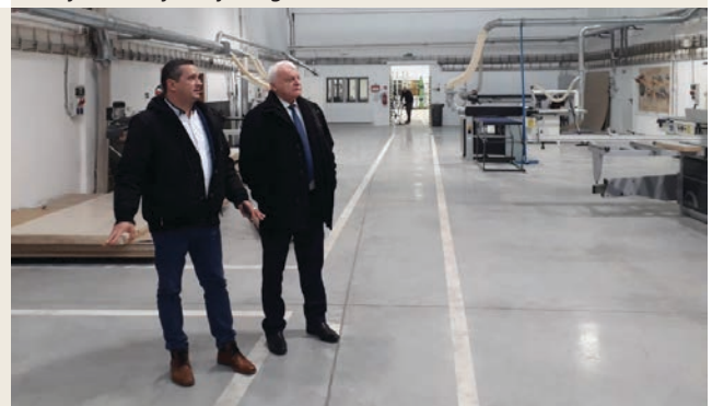
Delegácii bola predstavená aj infraštruktúra TUZVO