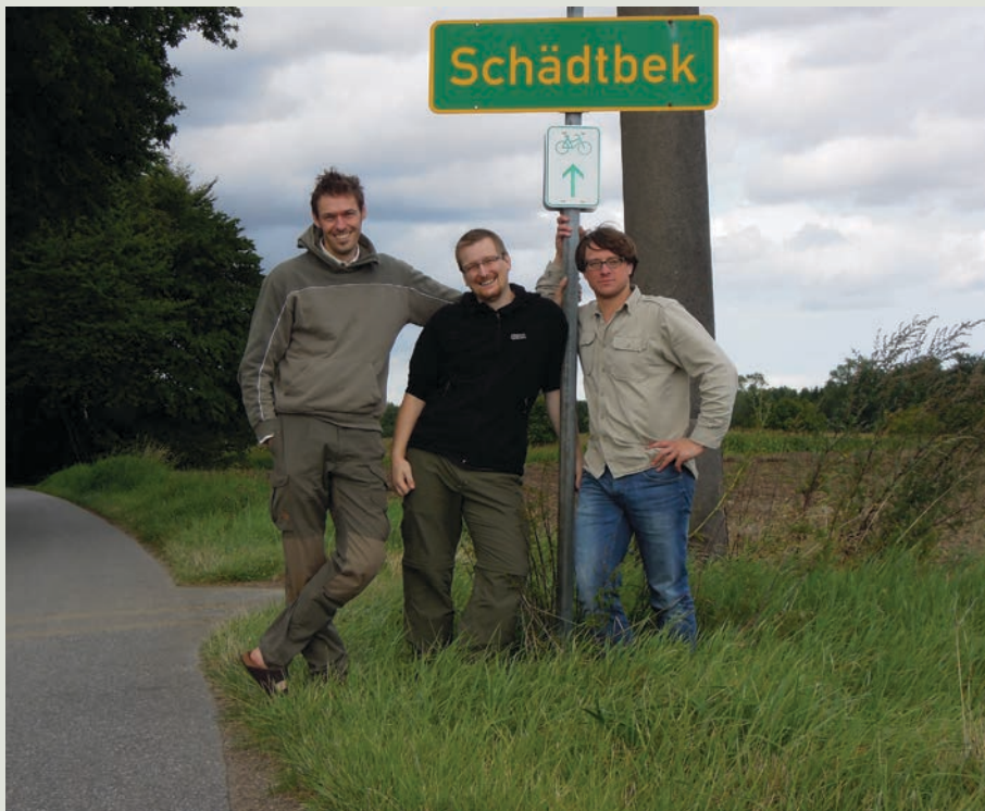
Terénne a laboratórne práce v Schädtbeku a v Göttingene