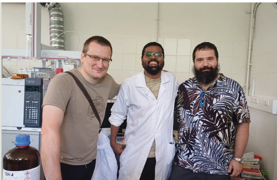
Laboratórium na prípravu vzoriek na ďalšie spracovanie (Maďarsko)

Autor: Daniel Kurjak, LF