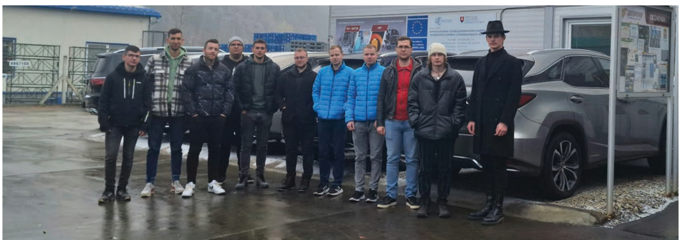
Študenti na exkurzii v spoločnosti Gevorkyan a.s. Vlkanová