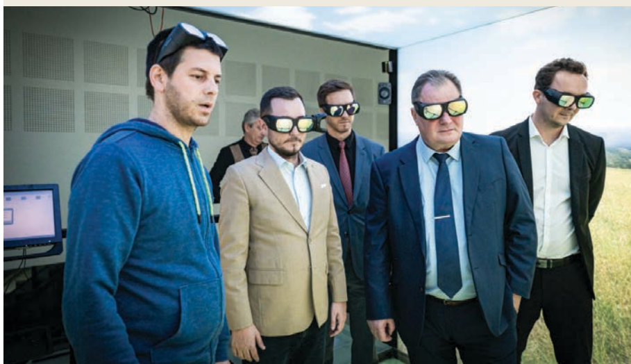
Návšteva simulátora biodynamiky lesa (Sibyla)

komplexe. Jeho úlohou je poskytovať kreatívny priestor na výrobu prototypov či servis v rámci výučby a vedeckovýskumných aktivít,“ uviedol rektor Rudolf Kropil.