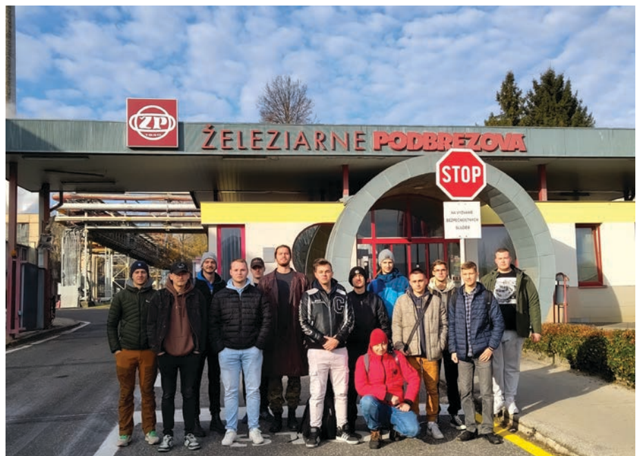
Študenti v Železiarni Podbrezová

Miroslava Ťavodová, FT