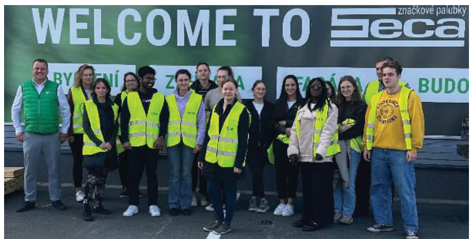
Návšteva v spoločnosti SECA

Študenti svojím návrhom prispievajú k lepšiemu oddychu turistov a návštevníkov Hájovne. Pridávajú sa tak k výtvarníkom a architektom, ktorí svojou prácou