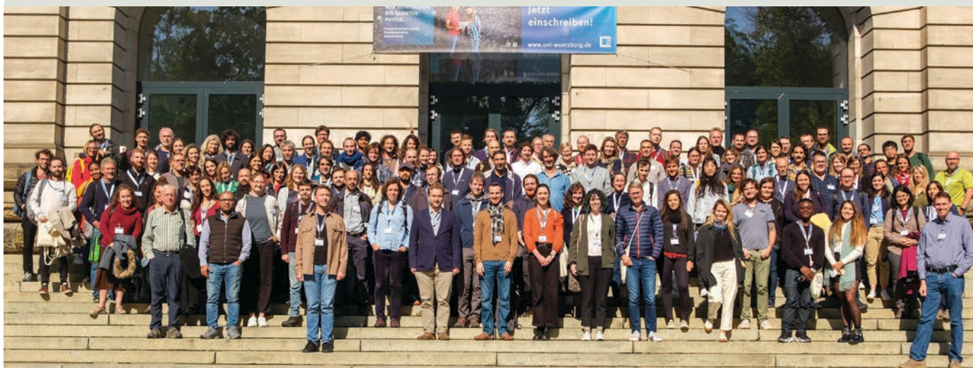
Medzinárodná konferencia vo Würzburgu