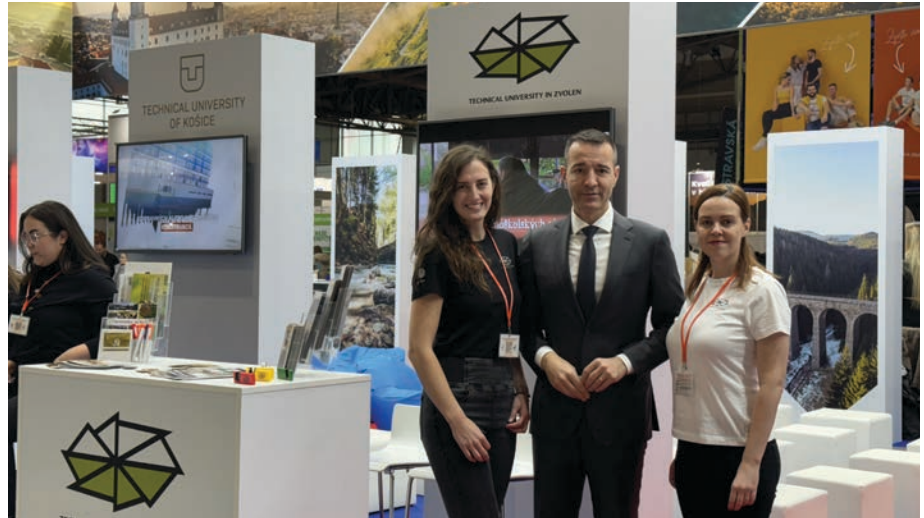
Stánok TUZVO navštívil aj minister školstva Tomáš Drucker

Neúnavne sme odpovedali na otázky o našich fakultách – Lesníckej fakulte, Drevárskej fakulte, Fakulte ekológie a environmentalistiky a Fakulte techniky. Samozrejme, nezabudli sme ani na celouniverzitný študijný program. Študenti si od nás odniesli cenné informácie o študijných programoch, možnostiach stáží,