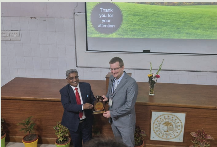
Odvzdávanie ocenenia za odprezentovanie pozvanej prednášky