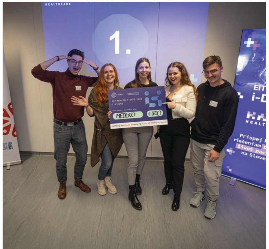
Študenti TUZVO a koordinátorky Welcome Hub-u

Víťazstvo v Banskej Bystrici bolo pre nás prekvapením a súčasne veľkým zadosťučinením. Znamenalo to, že naša práca a nasadenie stáli za to. Ako víťazi regionálneho kola sme získali možnosť pokračovať v súťaži na medzinárodnej