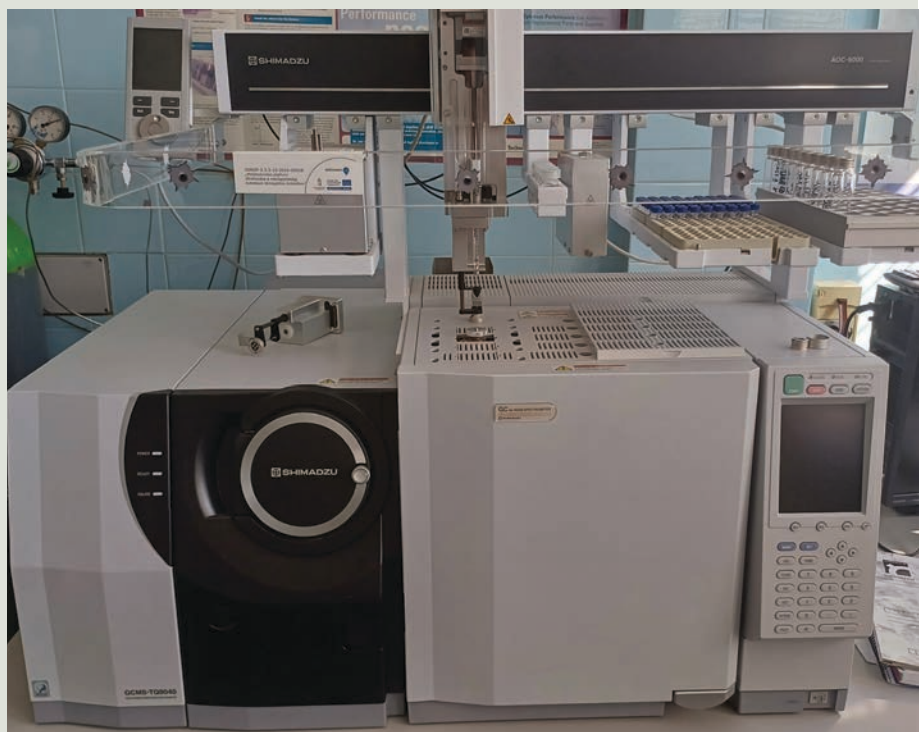
Moderné laboratórne vybavenie, Agricultural Institute (Maďarsko)

pokračovanie článku – nasledujúca strana