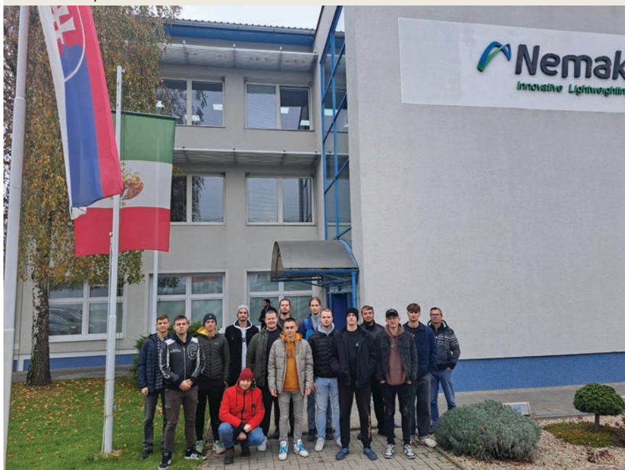
Exkurzia v spoločnosti NEMAK Slovakia