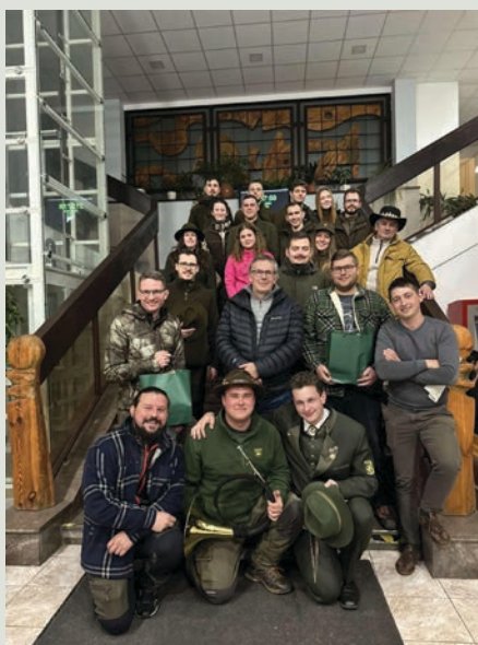
Spoločná fotka víťazov súťaže vo varení gulášu počas Dní sv. Huberta – 3. miesto kynologický klub TUZVO