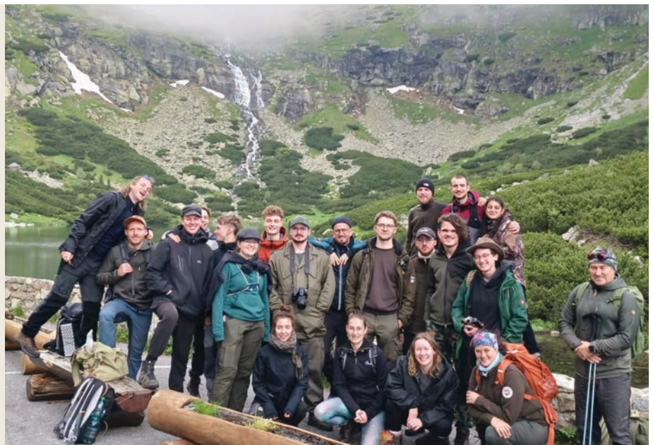
Účastníci exkurzie pri spoznávaní krás Slovenska