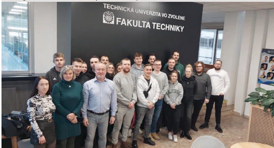
Spomienkové foto na Fakulte techniky

vzťahy medzi zamestnancami príbuzných univerzít a fakúlt, a to na pedagogickej i výskumnej úrovni.