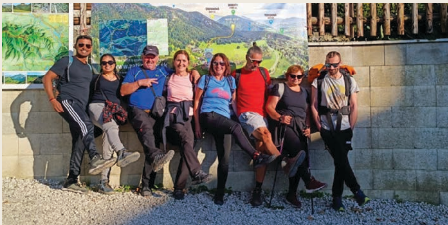
Dobrá nálada zamestnancov TUZVO počas výletu v Terchovej

V nedeľu sme sa zobudili opäť do krásneho slnečného dňa a rozhodli sme sa naplno si ho užiť. Jedni si išli pozrieť mestečko Terchovú s jej dominantou – sochou Juraja Jánošíka a veľkolepou Vyhliadkovou vežou s nádherným pohľadom na celú oblasť Malej Fatry. Druhí si išli pozrieť Terchovú z výšky a vyviezli sa lanovkou Vrátna až do výšky 1 490 m n. m., no a kto vládol, vybehol si až na Veľký Kriváň.