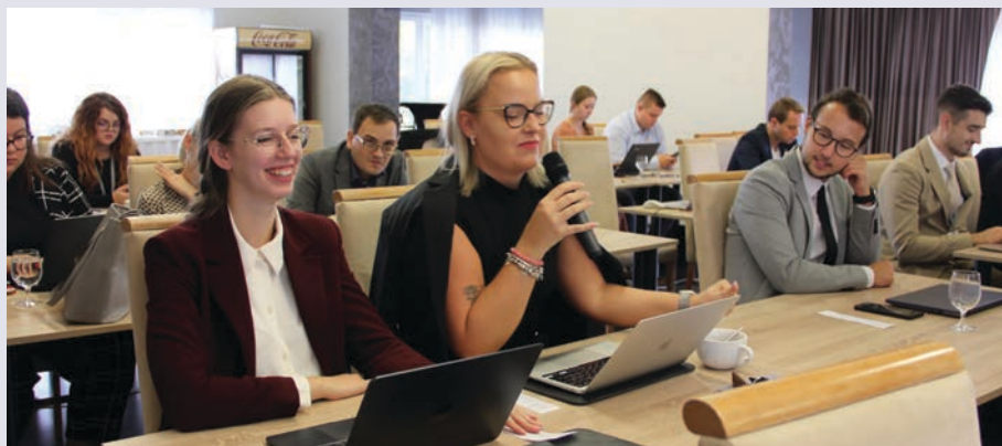
Priebeh zasadnutia valného zhromaždenia ŠRVŠ