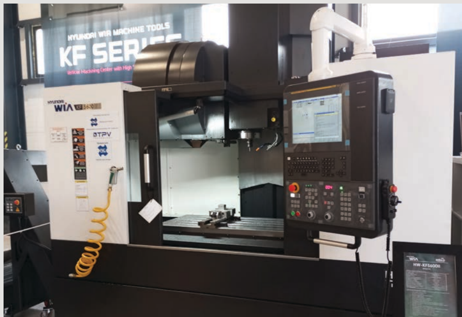
CNC frézovacie obrábacie centrum Hyundai Wia KF 5600 II

V samotnej novootvorenej hale prezentovala firma Profika tri kovoobrábacie stroje, dva od firmy Hyundai Wia, a to CNC sústružnícke centrum SE 2200 LS a CNC obrábacie centrum KF 5600 II, a jedno od firmy Hanwha CNC – sústružnícke zariadenie XD 26 III s automatickým podávačom obrobkov. Prezentovaný bol tiež priemyselný robot firmy Fanuc M20iD/35 určený na automatické zakladanie a vyberanie obrobkov z pracovného priestoru obrábacích strojov CNC.