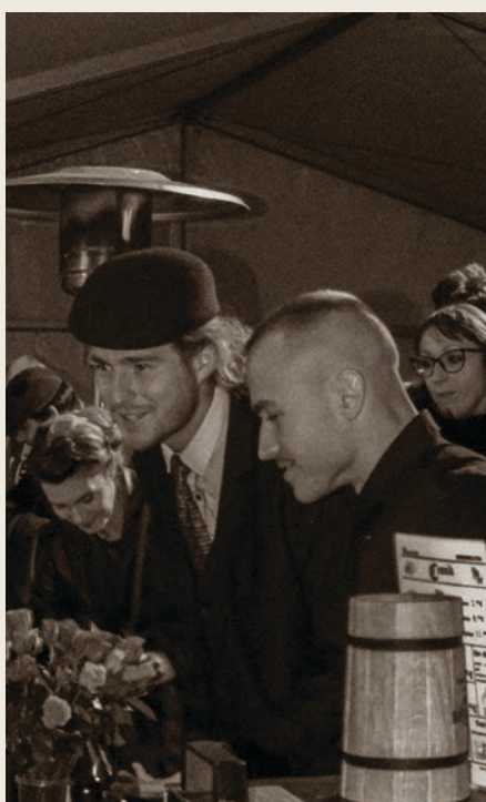
Atmosféra 30-tych rokov

Atmosféru 30. rokov dopĺňala nielen výzdoba v retro štýle, premyslené odevy návštevníkov podľa daného dresscode, ale aj živá hudba v podaní kapely Zvolenský vrchári. Vyvrcholením večera bola veľká tombola, z ktorej si výhercovia odniesli rôzne atraktívne ceny.