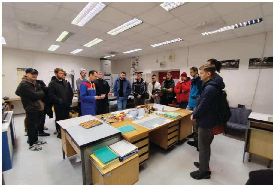
Exkurzia v metrologickom laboratóriu PPS a.s. Detva