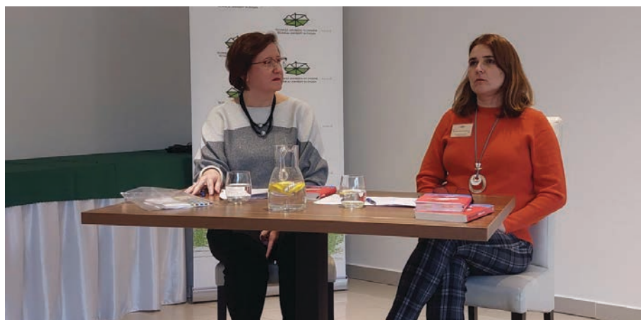
Diskusia o umeleckom preklade v španielskej literatúre